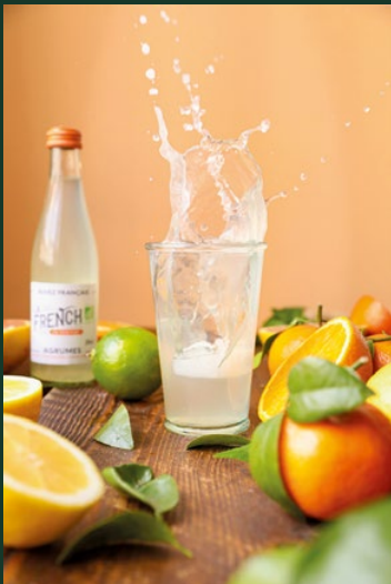
La French SVP