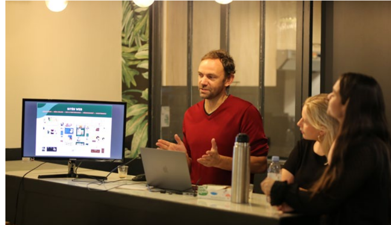
L'équipe de Divinemenciel dans leur bureaux marseillais

" Our family has been Tropezian for 13 generations. "