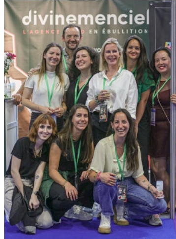
L'équipe de Divinemenciel au salon Food Hotel Tech 2022